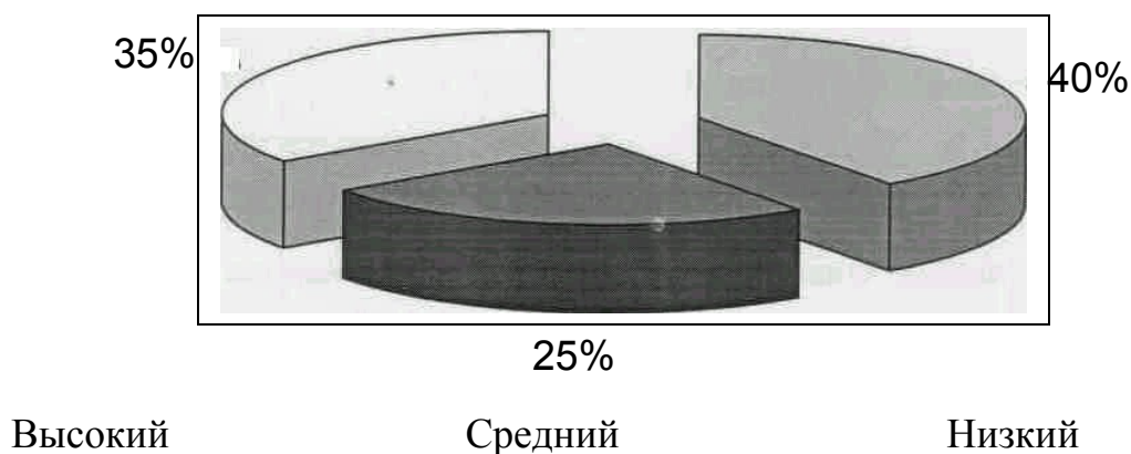
Рис.1. Диаграмма уровня экологической воспитанности учащихся в начале эксперимента

На данной диаграмме 35% подростков показали высокий уровень экологической воспитанности, 25% - средний, а 40% ответов отнесены к низкому уровню воспитанности. После проведения опытно – экспериментальной работы положение дел значительно улучшилось, что говорит о целесообразности внедрения этноэкологических знаний и ценностей в учебно-воспитательный процесс в целях формирования экологической культуры подростков.