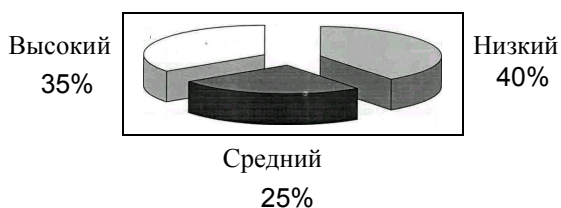
Рис.1. Диаграмма уровня экологической воспитанности учащихся в начале эксперимента

Для сравнения уровней экологической воспитанности учащихся до начала опытно-экспериментальной работы и после ее завершения мы приводим следующие диаграммы.